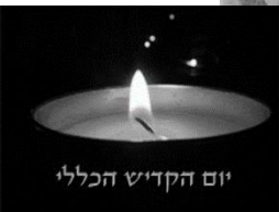
יום הקדיש הכללי